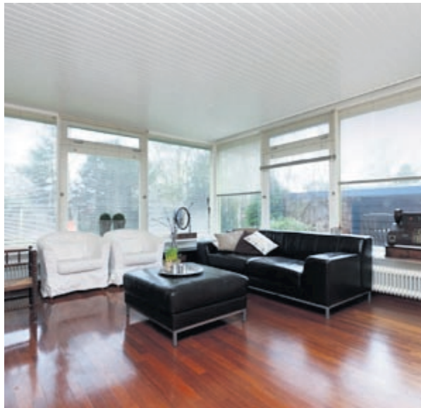
Later aangebouwde living op de tuinzijde

De ligging van de woning is gunstig ten opzichte van het nabijgelegen NS-station en het winkelhart van Winsum. De stad Groningen bevindt zich op ongeveer 14 kilometer afstand. Vanaf het NS-station rijdt er minimaal eens per uur een trein richting Groningen.