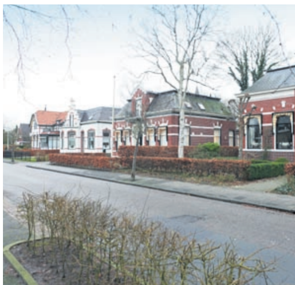
Straat met grote variatie aan rentenierswoningen.

De makelaars van de NVM Makelaars met passie